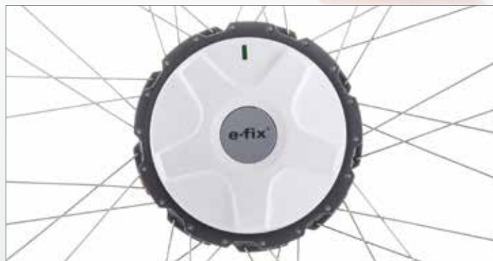
Motorisation compacte, légère, et puissante