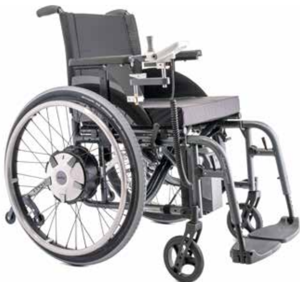
e-fix E36: Roues motrices plus puissantes que la version E35

Avec les roues motrices E36 plus puissantes et renforcées, e-fix peut être utilisé pour des personnes pesant jusqu'à 160 kg. La double commande intuitive disponible en option transforme le e-fix en une parfaite aide à la poussée et au freinage pour votre accompagnant. Il existe une gamme complète d'accessoires afin de vous rendre la vie plus facile et vous fournir plus de confort.