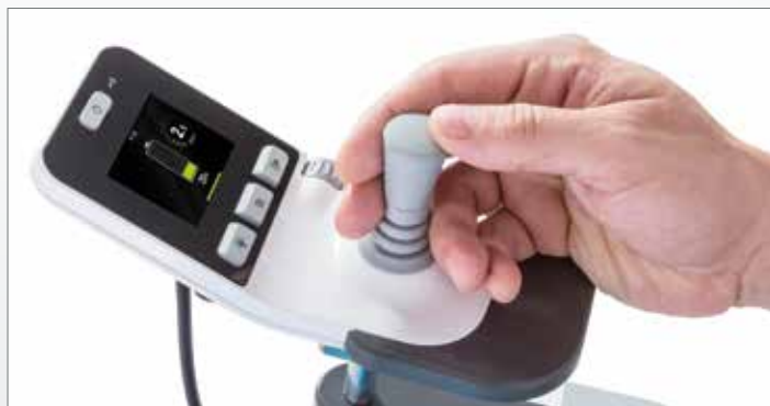
Écran couleur d'informations et éléments de commande conviviaux